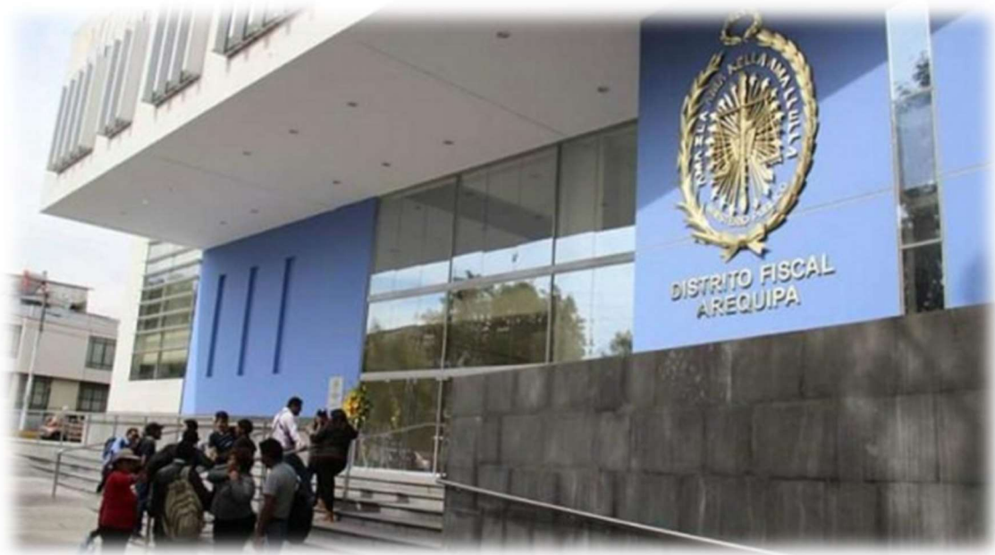
Ministerio Público – Fiscalía de la Nación Distrito Fiscal de Arequipa