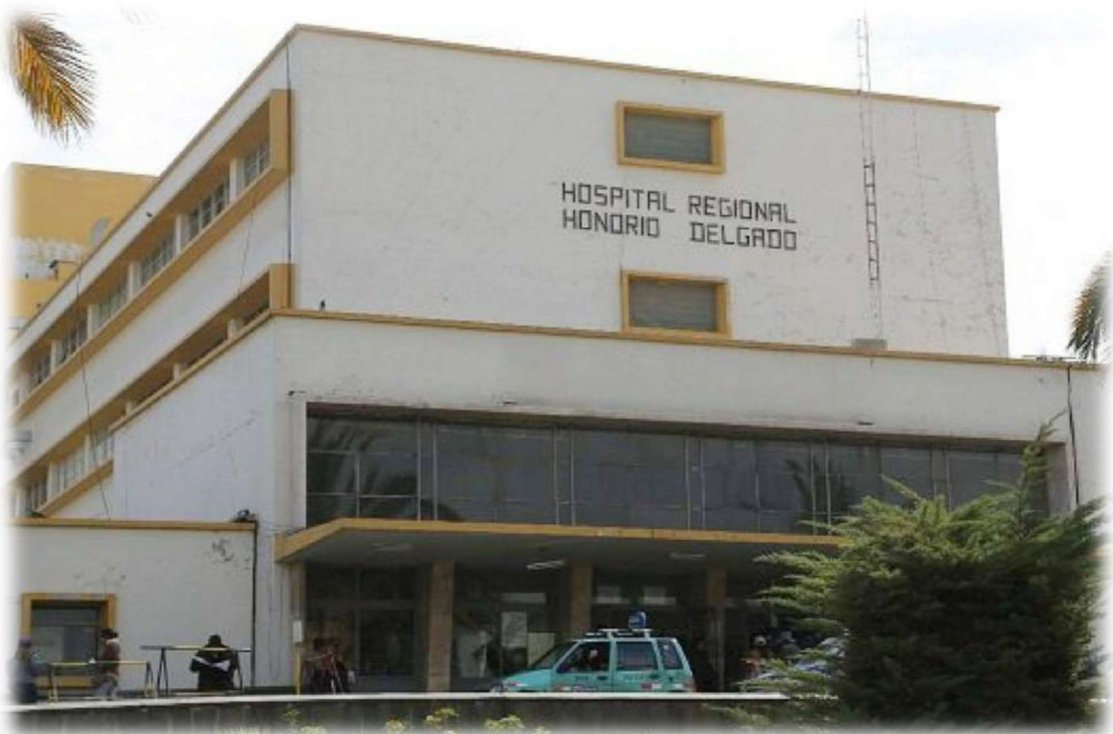
Hospital Regional Honorio Delgado