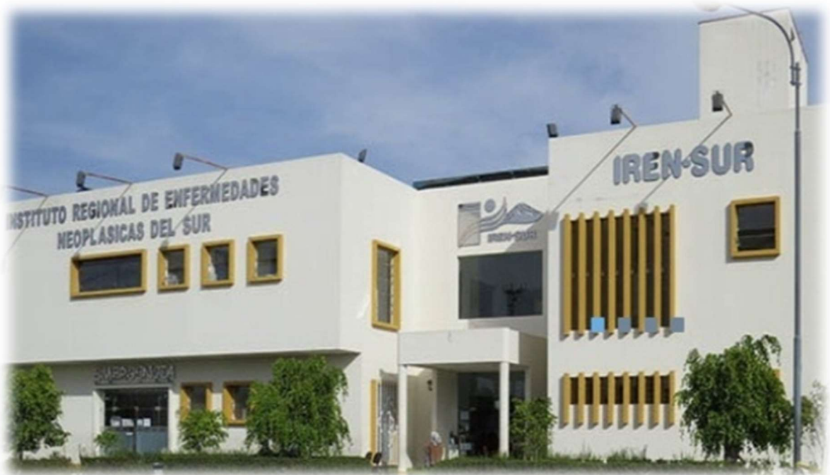
Instituto Regional de Enfermedades Neoplásicas del Sur