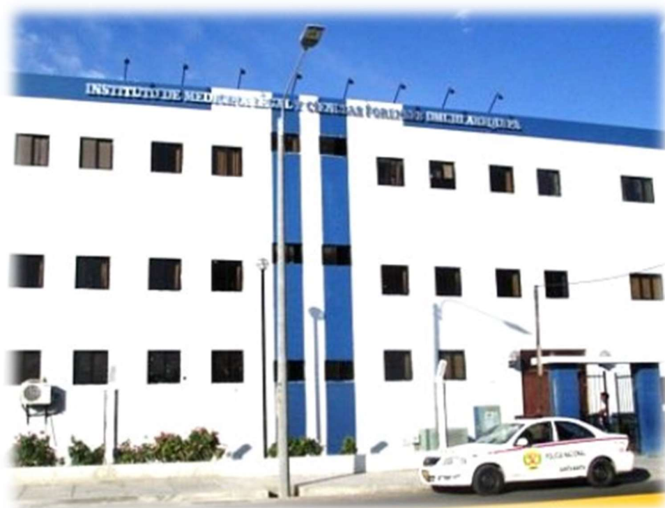
Instituto de Medicina Legal del Ministerio Público