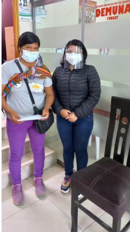
Anexo 9: Evidencias visuales de las encuestas realizadas a los usuarios de la DEMUMA de la provincia de Yungay, que celebraron actas de conciliación sobre alimentos durante el año 2018.