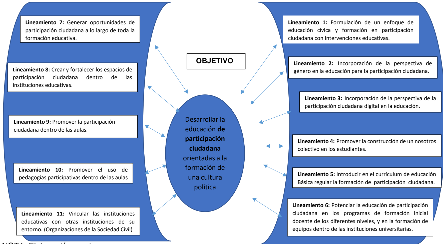
Diagrama de Política educativa de participación ciudadana en Educación Básica Regular para Formación de Cultura Política estudiantil en Instituciones Educativas de Chiclayo