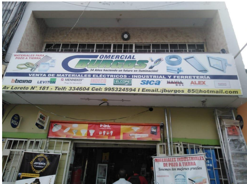
Empresa Comercial Burgos.