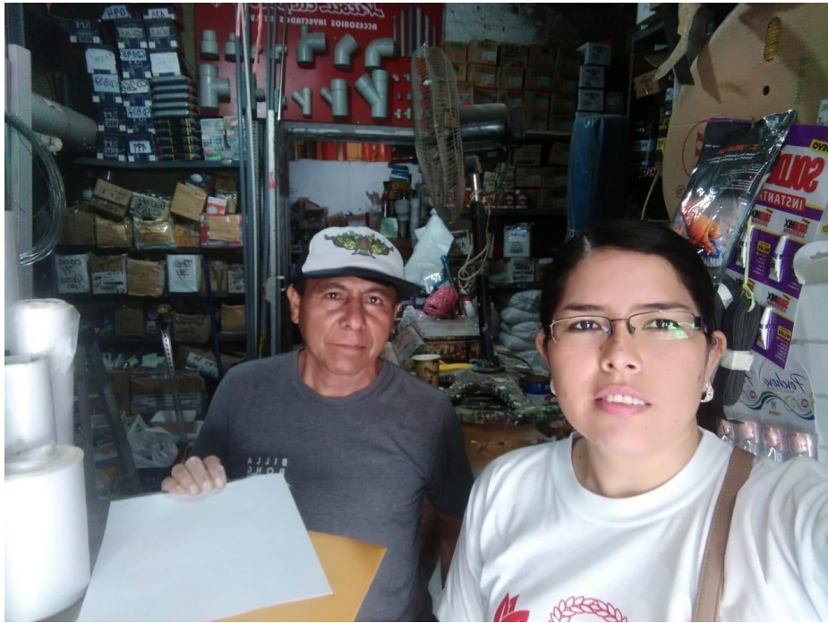
Aplicación de instrumento por la investigadora.