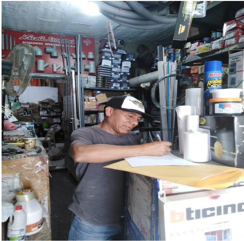
Inventarios de la Empresa