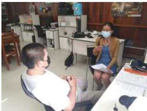
Entrevista al Especialista Ambiental del Área de Conservación y Servicios Ambientales de la DEACRN