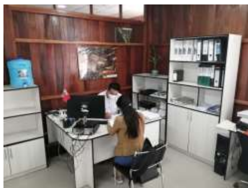
Entrevista al Coordinador del Área de Conservación y Servicios Ambientales de la DEACRN