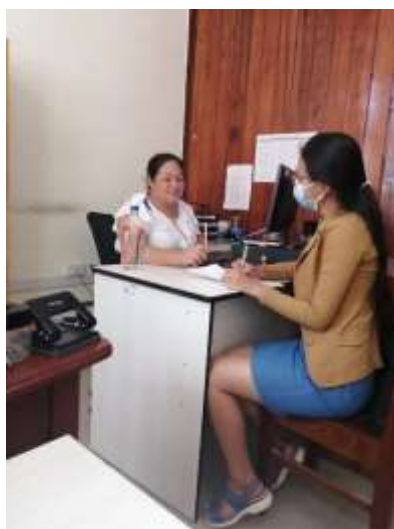
Entrevista a la Asesora Legal de las Direcciones Ejecutivas