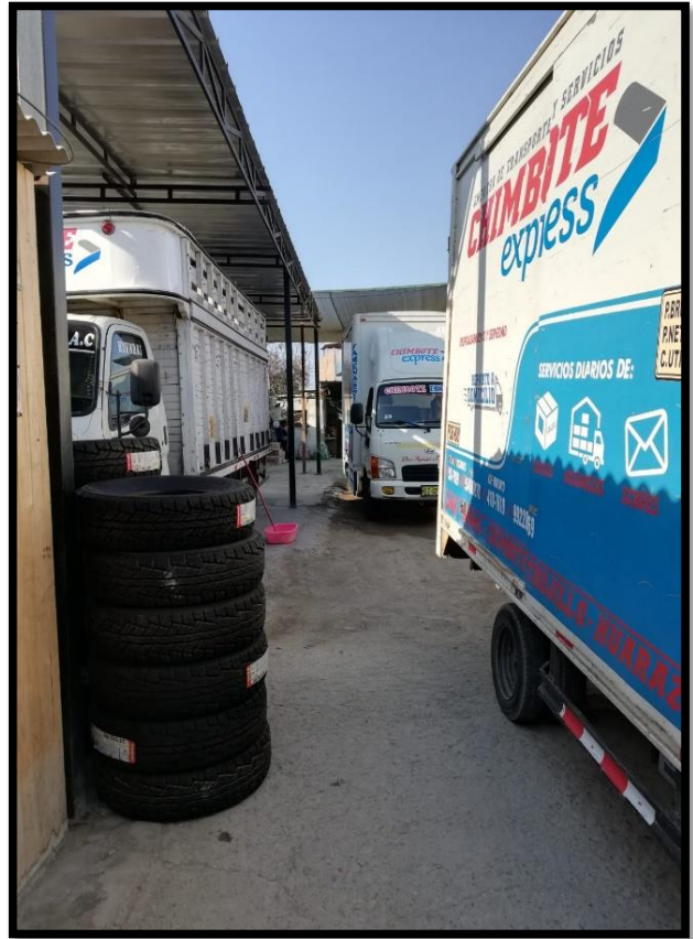
Imagen N° 04: Mercadería recién llegada de Lima-Chimbote.