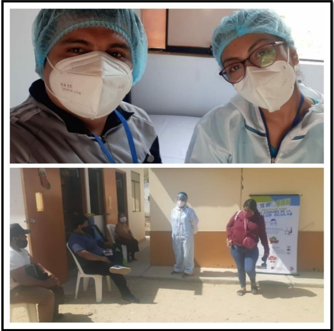
EVIDENCIA DEL MODO PRESENCIAL