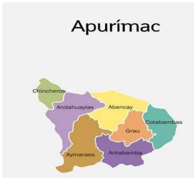
Figura 5. Provincias de Apurímac

La Región de Apurímac se encuentra situada en la parte Sur de los Andes Centrales del Perú, está constituida por 7 provincias: Abancay, Andahuaylas, Chincheros, Antabamba, Aymaraes, Cotabambas y Grau.