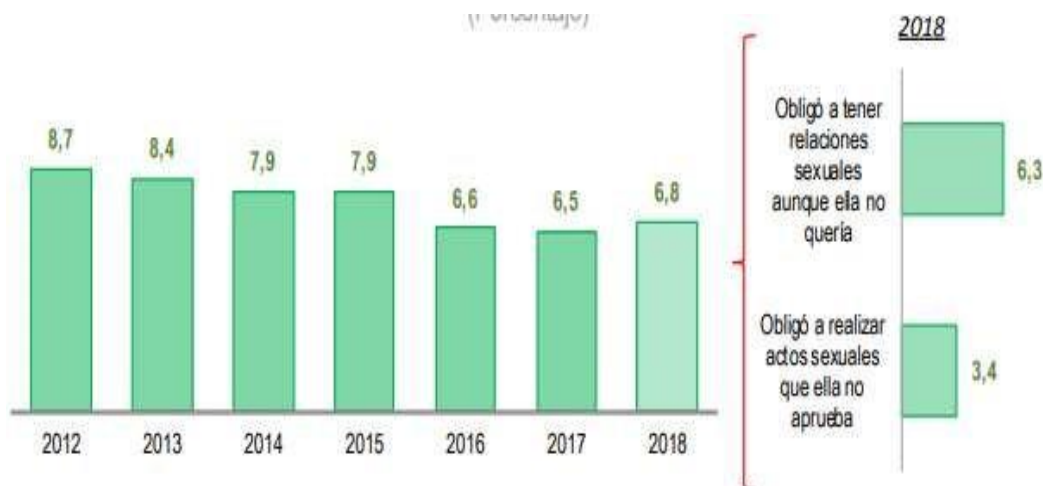
Figura 2. Violencia sexual contra la mujer