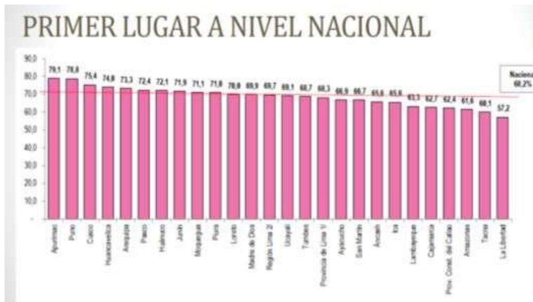
Figura 3. Primer lugar en violencia hacia mujeres

registran a la región en primer lugar a nivel nacional, esto se contempla en la figura 3.