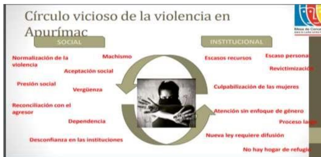
Figura 4. Círculo vicioso de la violencia en Apurímac

Estudios realizados por la Mesa de Concertación para la Lucha contra la violencia hacia la mujer (2017) demuestran la existencia de un círculo vicioso tanto en los espacios públicos y privados, donde el poder social por costumbre atribuido al hombre como sujeto que debe cuidar del sexo débil, ha generado innumerables casos de violencia en la mujer de la región de Apurímac, en la figura 4, se puede observar la situación que vive la mujer en la región.