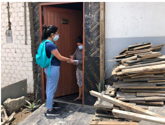
Ilustración 3: Realización de encuesta