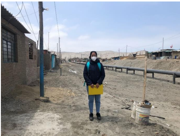
Ilustración 2: Asentamiento Humano “Las Brisas de Salaverry”