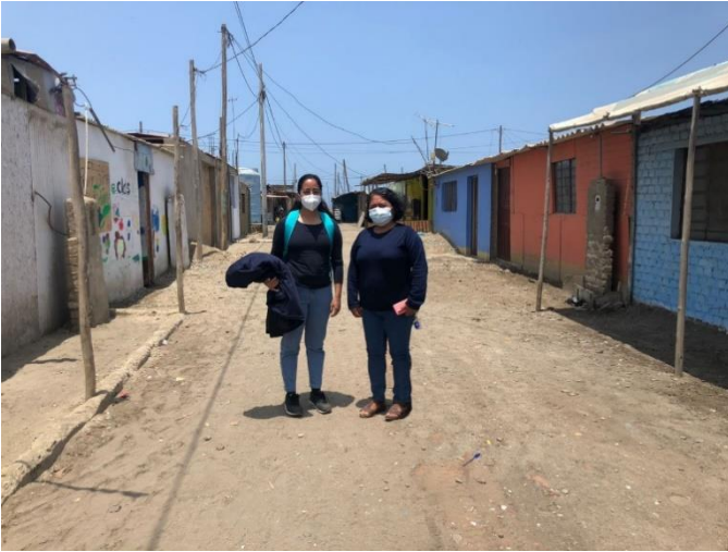
Ilustración 1: Vice presidenta del Comité de Gestión Urbanístico de “Las Brisas de Salaverry”