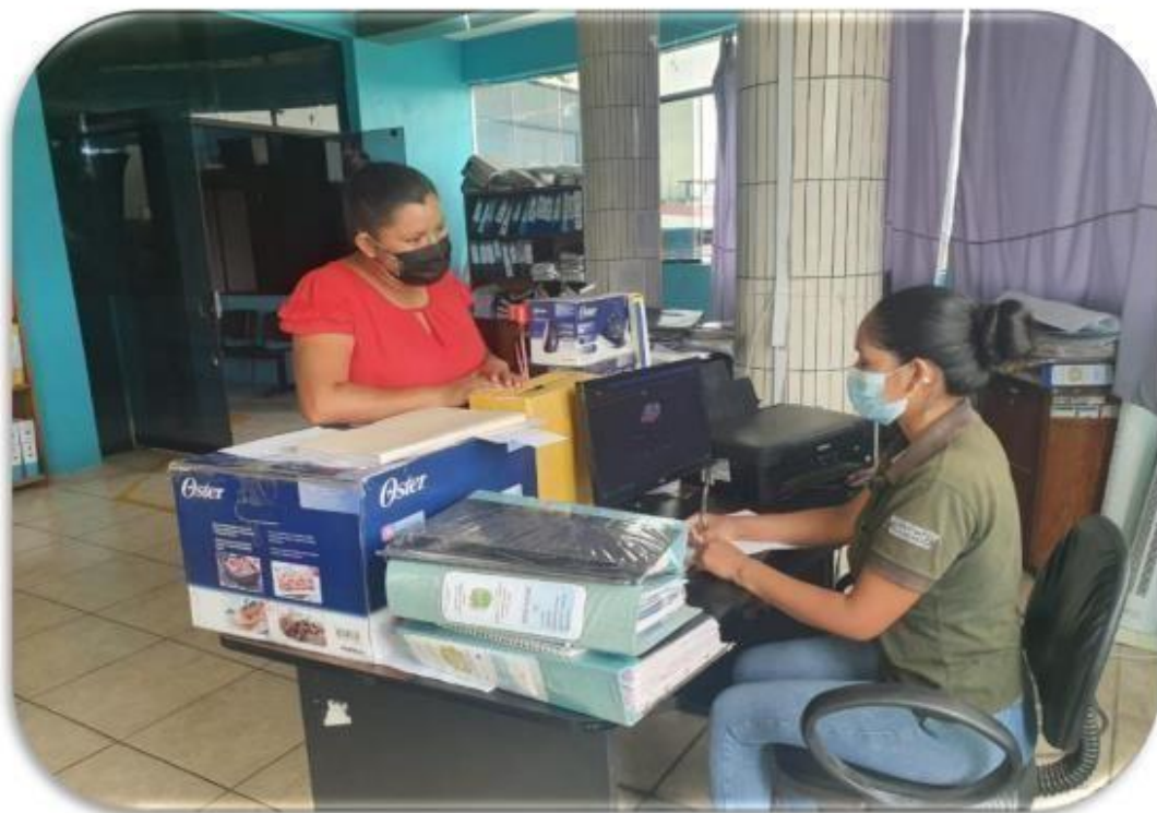
Panel fotográfico 3° Entrevista.