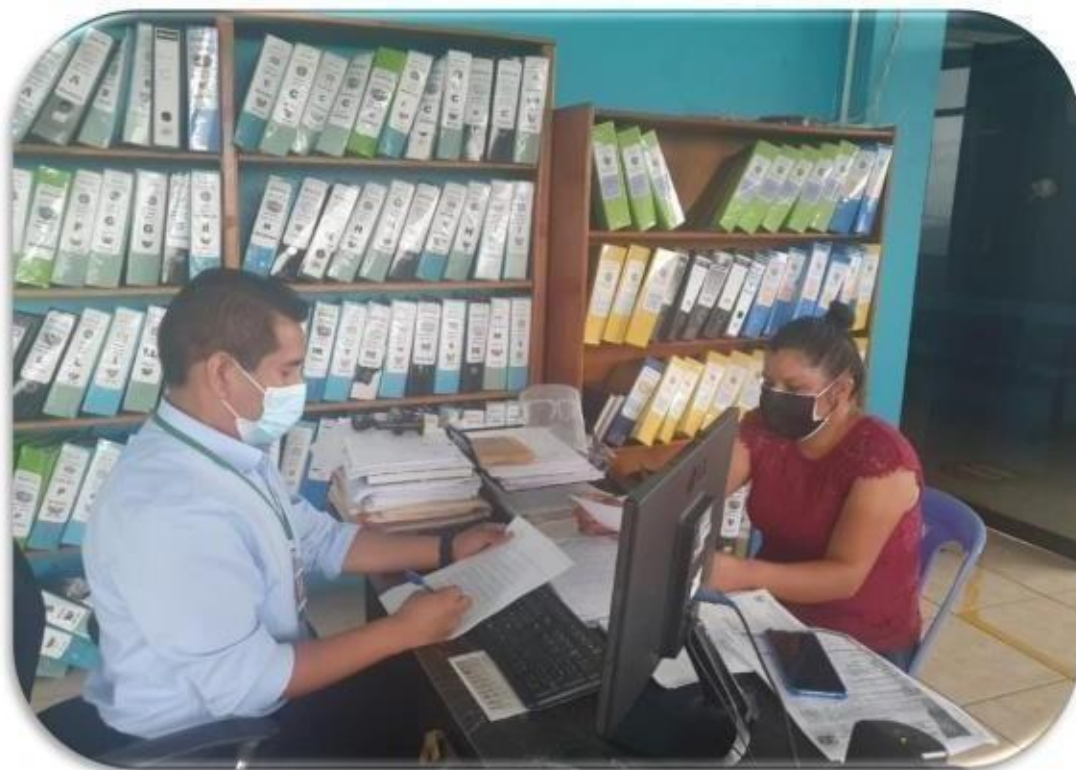
Panel fotográfico 5° Entrevista.