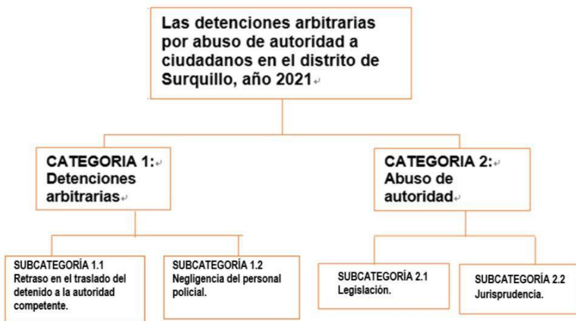
Figura 1: Categorías y subcategorías.

Como segunda categoría tenemos al “abuso de autoridad”, para ello, es conveniente abordar dos subcategorías, de modo que, la primera subcategoría se relaciona a: La legislación, la cual se ocupa de la norma sobre el abuso de autoridad, y la segunda subcategoría habla de: La jurisprudencia, la misma que aborda resoluciones que analizan los casos de abuso de autoridad.