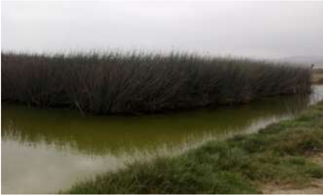
Figura 1 Humedales de Ventanilla