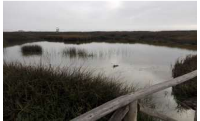
Figura 2 Senderos en los Humedales