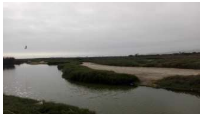
Figura 3 Vista desde el mirador de los humedales