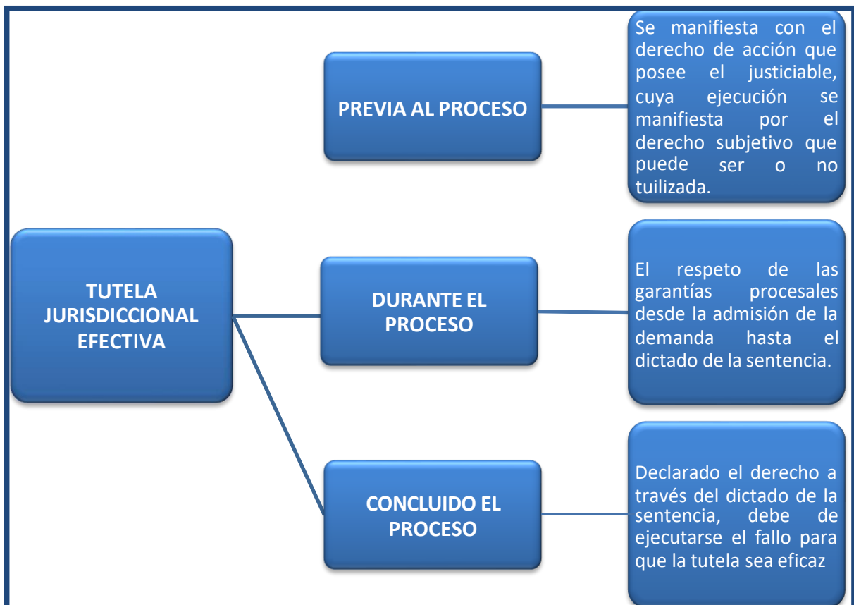
Gráfico 2. La tutela jurisdiccional en las diversas etapas del proceso, elaboración propia.

la justicia; (ii) el debido proceso; y, (iii) todo lo que tiene que ver con la efectividad misma de la ejecución de una decisión. En resumen, en el momento actual ostentamos un derecho bastante amplificado, dígame tutela jurisdiccional efectiva o debido proceso. Es menester recalcar que no está solamente comprendido por indicios procesales, sino que ostenta un margen de entrada para admitir el control de cualquier acto que contenga cierta dosis de poder; pero enfocándose más en sentencias vulneradoras de los derechos fundamentales dentro de la esfera de su núcleo. Empero eso es lo que existe en la actualidad, en esa línea la tutela jurisdiccional o el debido proceso se transfiguran en un instrumento esencial de orden en primera línea para el resguardo de los derechos fundamentales. (Bustamante Alarcon, 2019, pág. 39)