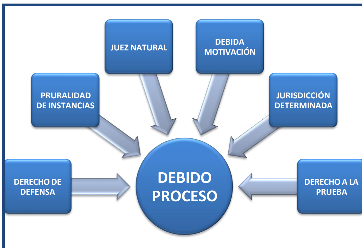
Gráfico 1. El debido proceso como derecho continente, elaboración propia

Es que en ese sentido este derecho fundamental ha sido descrito de la siguiente forma sobre el debido proceso se estructura como la diagramación jurídica que, previamente, restringe las facultades estatales y gesta garantías de resguardo para la debida protección de los derechos individuales de tal manera que cada actuación por parte de las autoridades jurisdiccionales nunca quede a merced de su arbitrio propio, sino que quede sujeto de manera permanente al proceso mencionado en la ley. (Cortes Tataje, 2012, pág. 183).