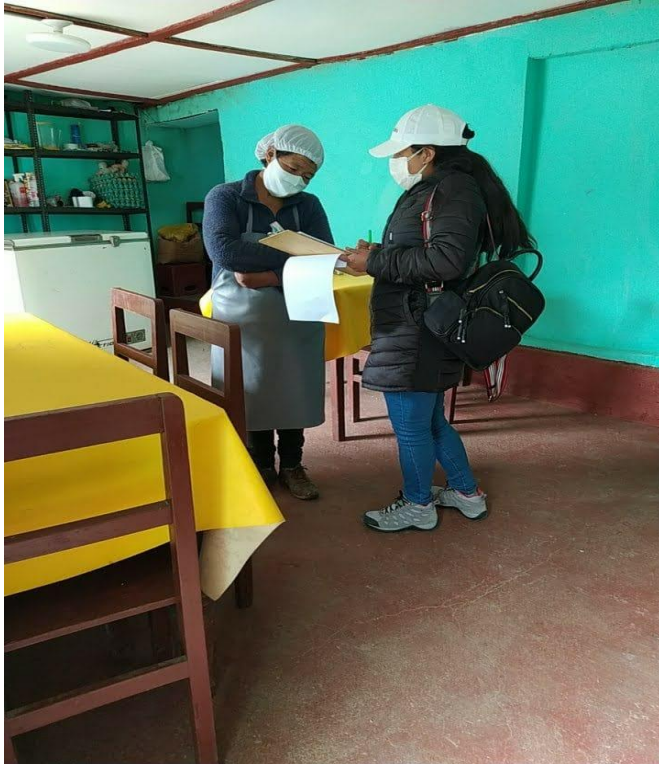
Foto haciendo la recolección de datos día 16.06.2021, 10:00am