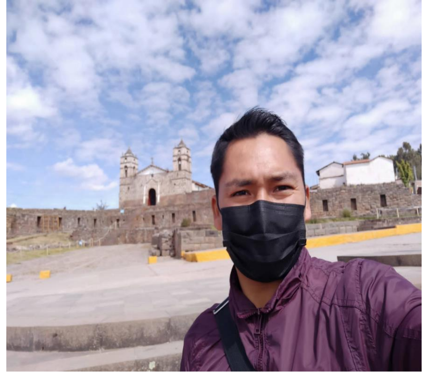
Foto que acredita el lugar donde se realizó las encuestas día 16.06.2021, 10:am