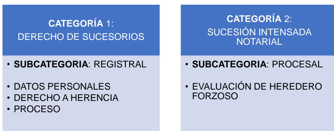
Figura 1. Categorización

Subcategorías: Procesal y como subelemento se busca evaluar el heredero forzoso