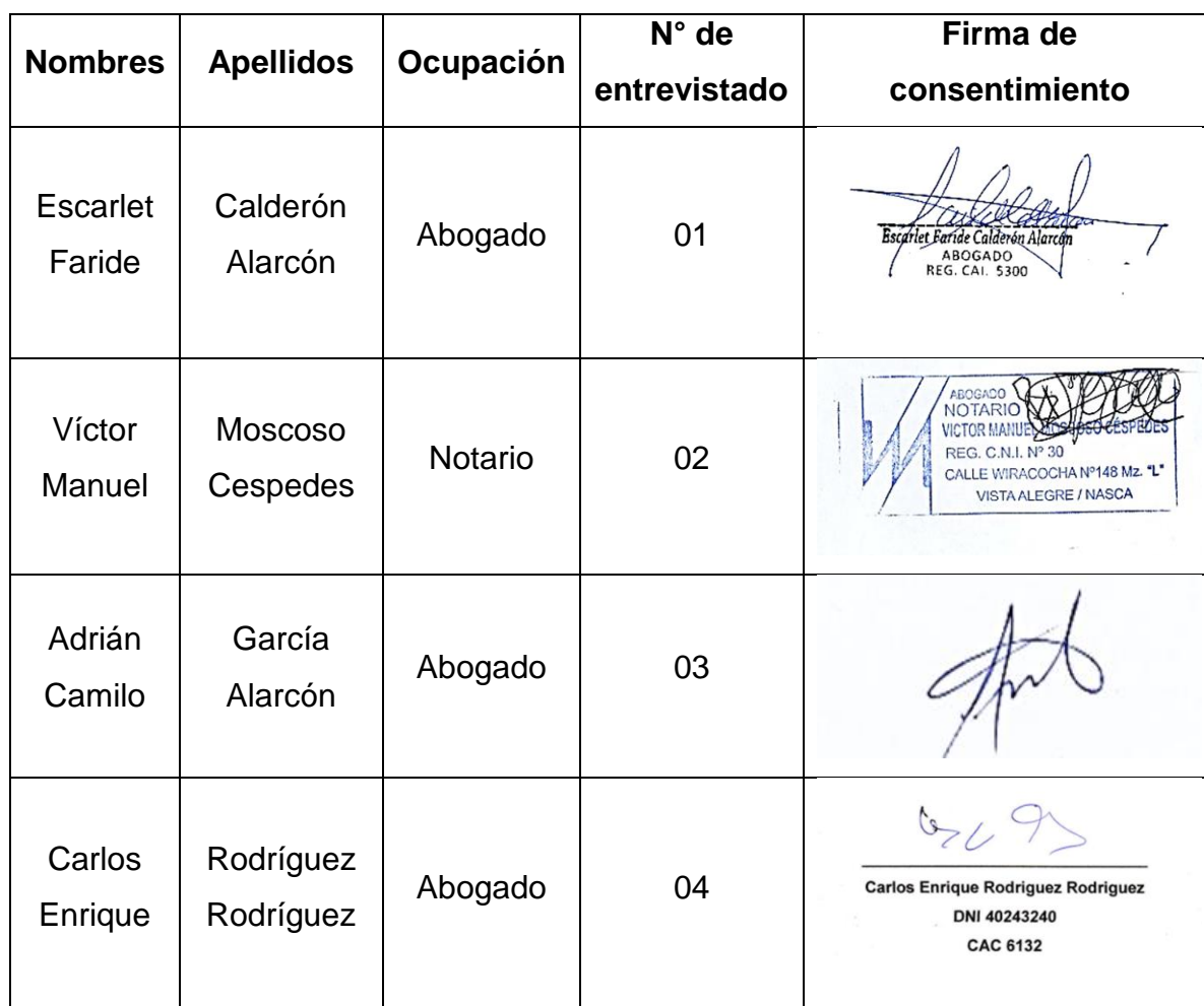
Tabla 1 Participantes

Moscoso de la Provincia de Nazca La Muestra será una parte considerable de la población seleccionada anticipadamente, ya que con ello se realzará la investigación. La muestra elegida dependerá de la calidad y de cuán representativo se quiere que sea el estudio de la población (Hernández y Mendoza, 2018). Para la muestra se seleccionaron a 10 especialista en notaria con amplia experiencia en casos de herencia y sucesión que a su criterio y las normas que rigen tal derecho puedan servir de análisis crítico y sustancial para la elaboración de resultados.