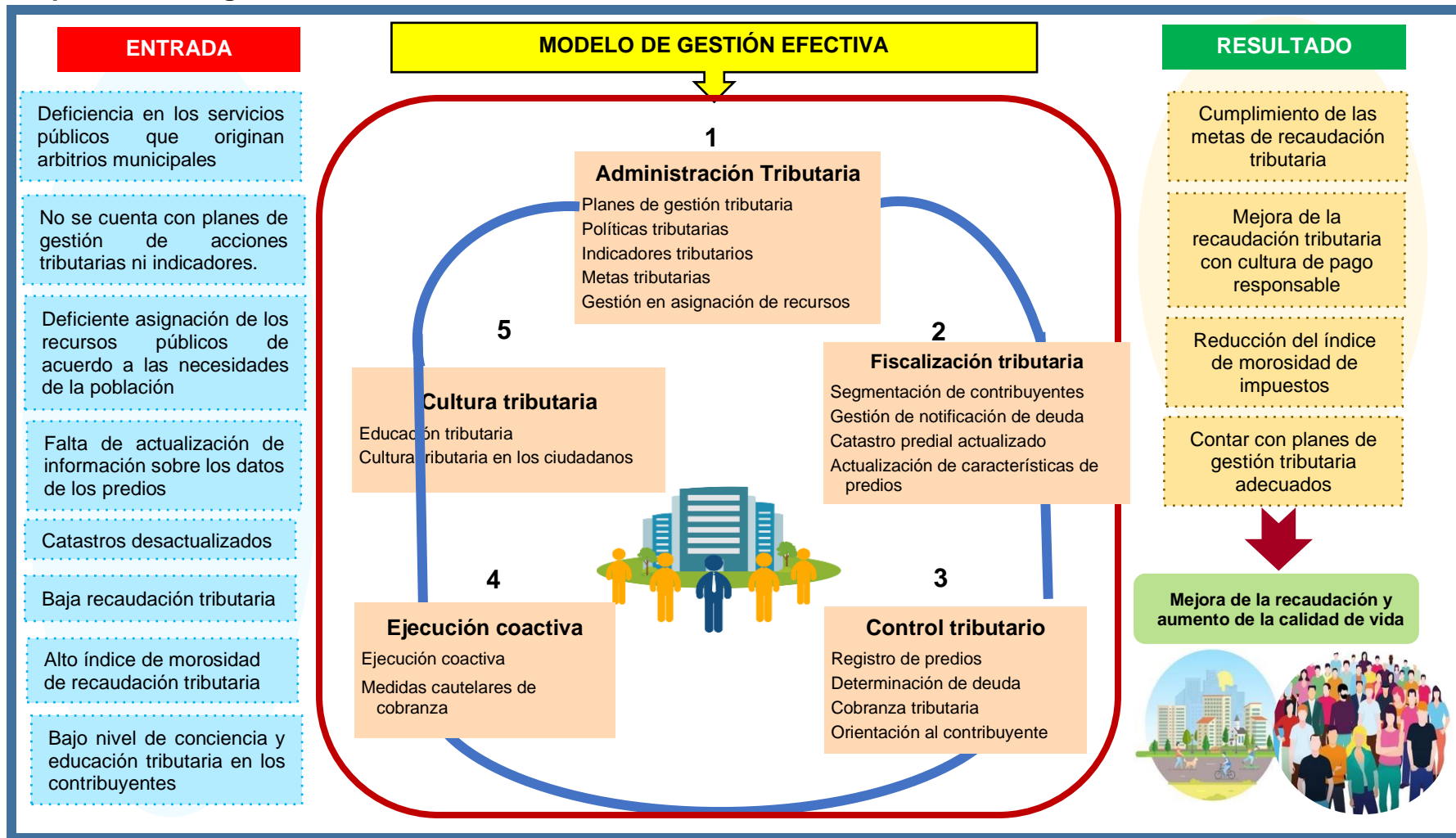
Figura 1. Modelo de gestión efectiva.