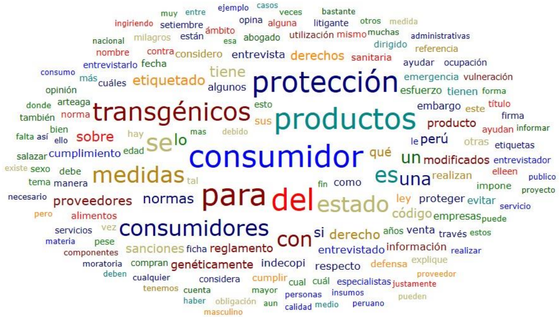
Figura 2. Nube de palabras

Los entrevistados MRPG1, PDYJ2 y LSMY4 coinciden en que actualmente no hay alguna medida tomada a fin de proteger a los consumidores de los productos genéticamente modificados, o en su defecto no afectar su derecho a informarse de los productos que están comprando para su consumo. Sin embargo, no se descarta el hecho de que es probable que la asociación peruana de consumidores y usuarios realice algún futuro proyecto en miras de proteger a los consumidores del país, se debe señalar que, ante tiempos de emergencia sanitaria, los consumidores se ven aún más vulnerables solo con el hecho de salir de casa a comprar un producto para su subsistencia diaria.