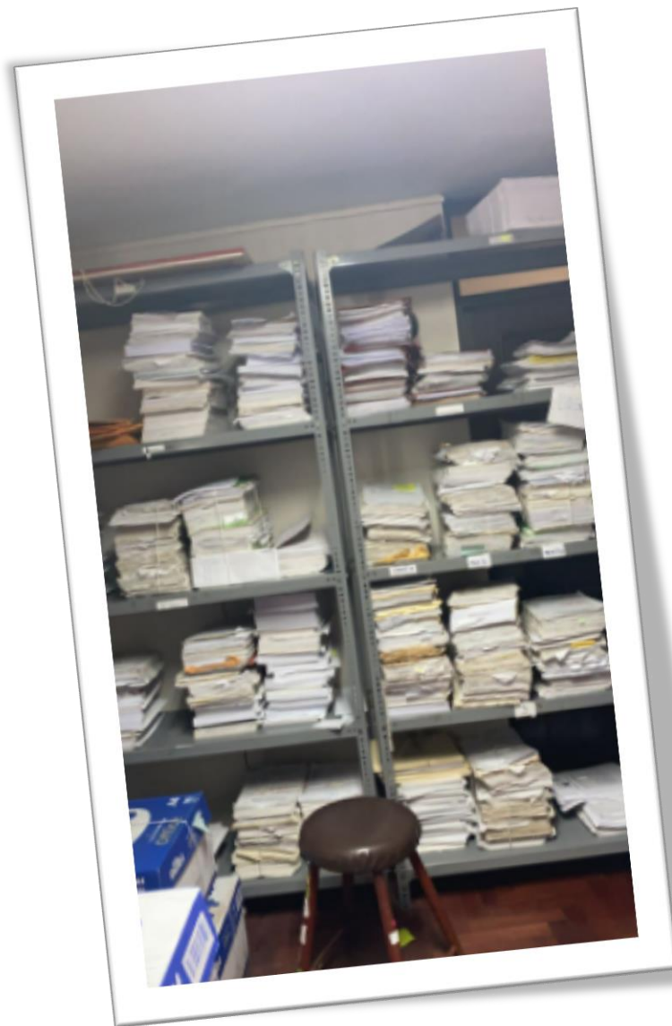
Figura Nº 1