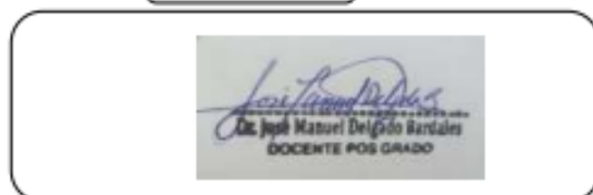
Sello personal y firma