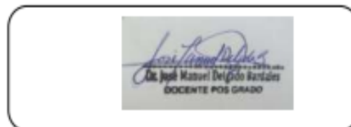
Sello personal y firma