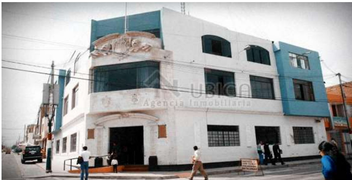
Foto N°2: Encuentra realizada a trabajadores de la Municipalidad. Fecha 05/07/2021.