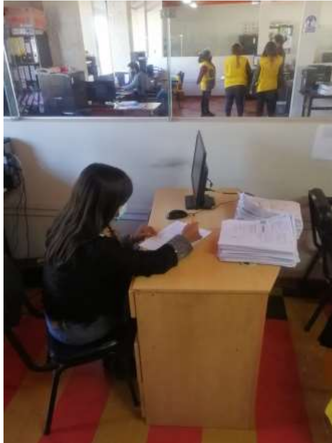
Foto N° 6: Se visualiza al autor dando directivas para el llenado de las encuestas. Fecha 05/07/2021.