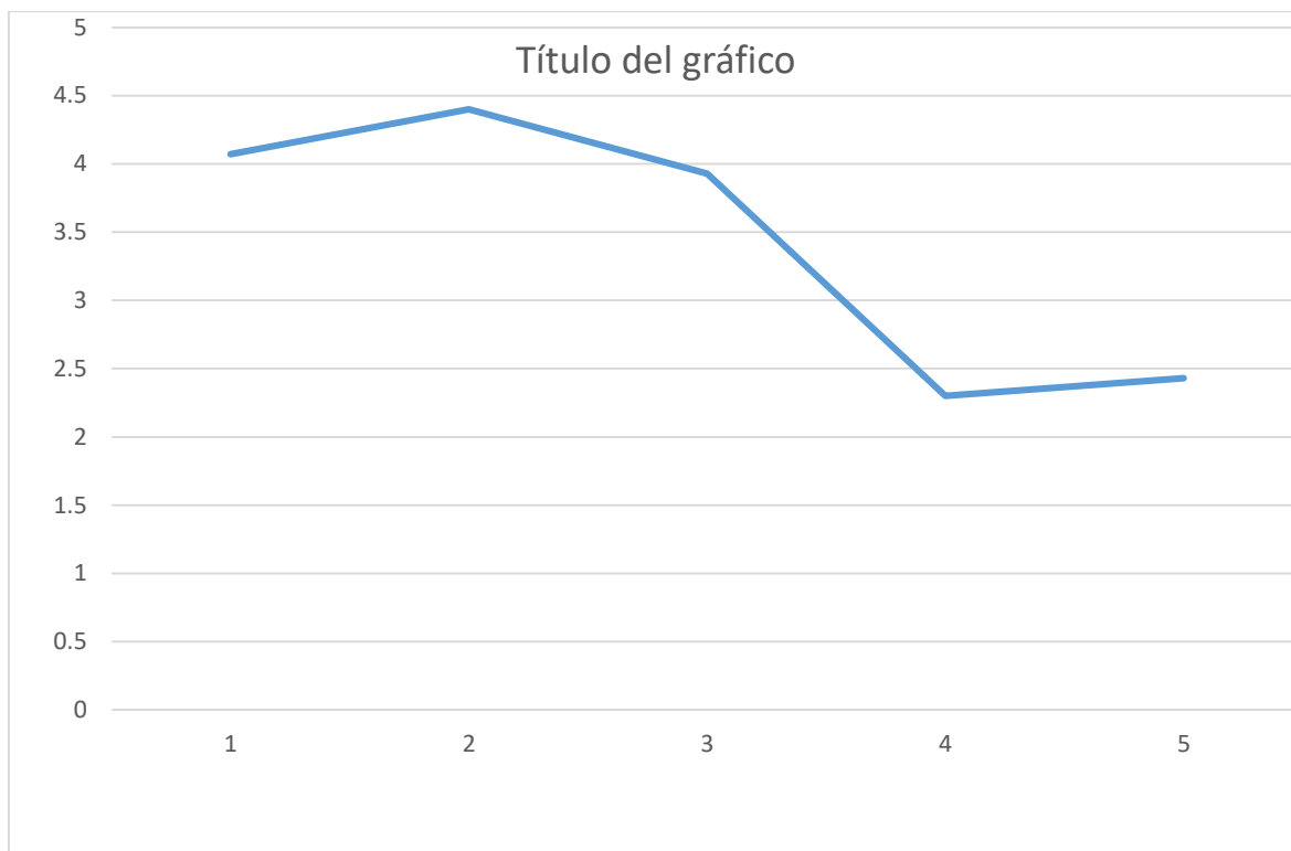
Figura 1. Nivel de infracciones administrativas en la Municipalidad Distrital de Cerro Colorado. Arequipa. 2021.

Interpretación de la tabla: Que, el nivel mínimo es de 2.3 y el nivel máximo es de 4.40, siendo el promedio del nivel de infracciones en la Municipalidad materia de estudio es de 3.44, lo que indica una escala promedio “regular”.