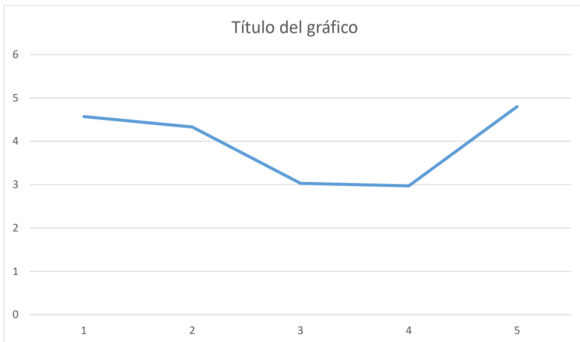
Figura 2. Nivel de sanciones administrativas en la Municipalidad Distrital de Cerro Colorado. Arequipa. 2021.

Interpretación de la tabla: Que, el nivel mínimo es de 2.97 y el nivel máximo es de 4.57, siendo el promedio del nivel de sanciones en la Municipalidad es de 3.94, lo que indica una escala promedio “alto”.