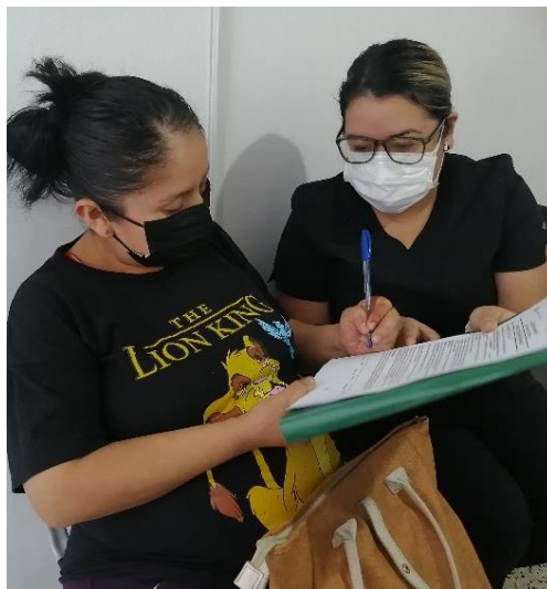
Foto 4 RECOLECCIÓN DE DATOS