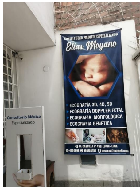
Foto 1 CONSULTORIO MÉDICO ELÍAS MOYANO EIRL