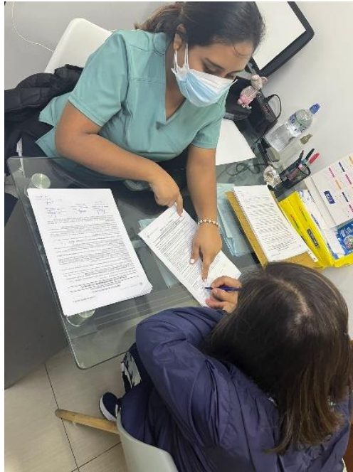
Foto 3 RECOLECCIÓN DE DATOS