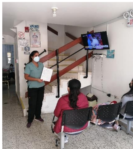
Foto 2 EXPOSICIÓN SOBRE TEMA DE INVESTIGACIÓN A MADRES GESTANTES