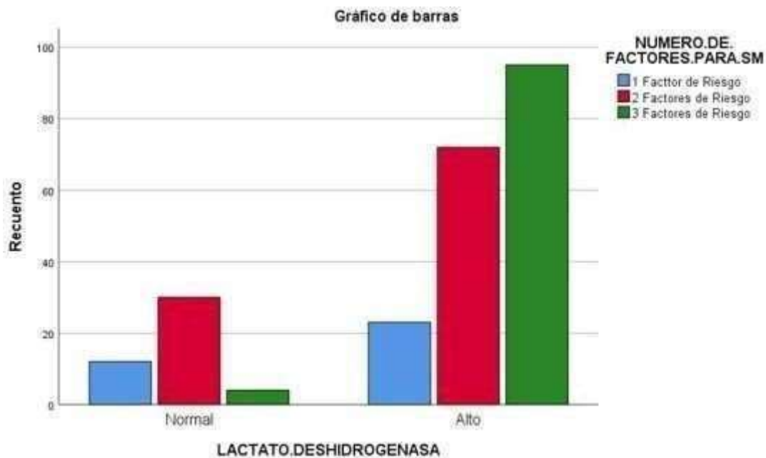
GRÁFICO DE BARRAS: RELACIÓN DEL PARÁMETRO DE LABORATORIO: DHL Y NÚMERO DE FACTOR DE RIESGO PARA SÍNDROME METABÓLICO