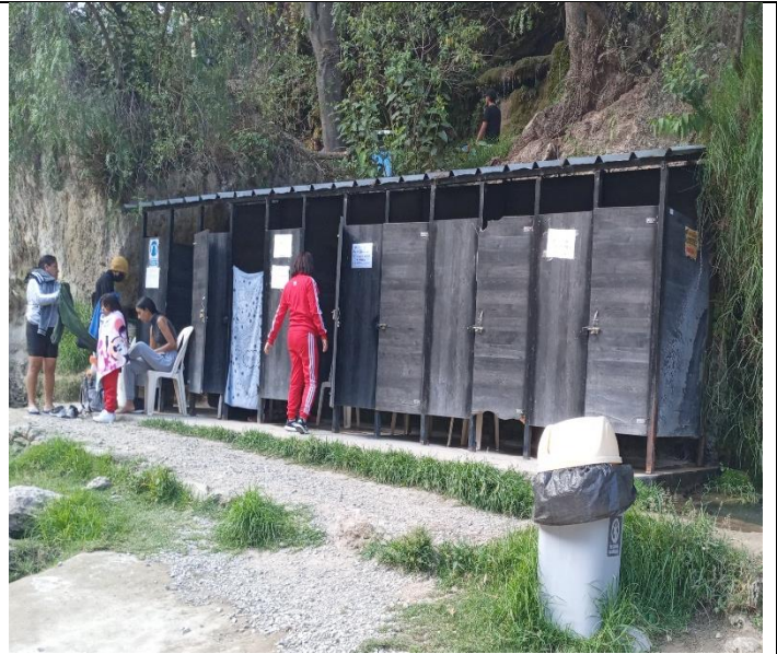
Tipos de servicios que ofrecen los baños termales (letreros informativos)