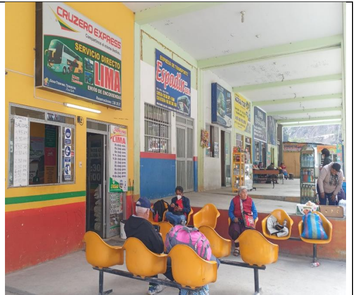
Estado de las zonas urbanas