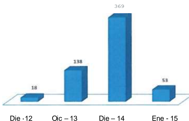
Figura I. Progresión de IIEE de EBR que ingresaron en el proceso de acreditación por años

En el 2012 se inicia el registro de instituciones educativas en el proceso de acreditación, siendo progresivo el crecimiento del número de instituciones que año a año optaron voluntariamente por autoevaluarse e ingresar oficialmente en el proceso conducente a la acreditación.