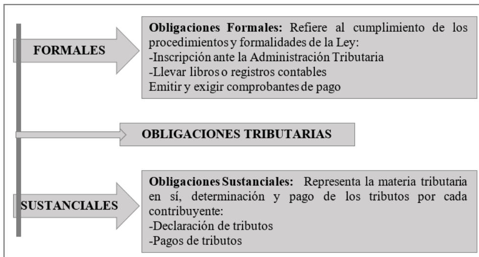
Figura 1. Obligaciones tributarias

Teniendo en cuenta a los autores nacionales e internacionales, con respecto a las variables de estudio: cultura y sus obligaciones tributarias, quienes concluyen: