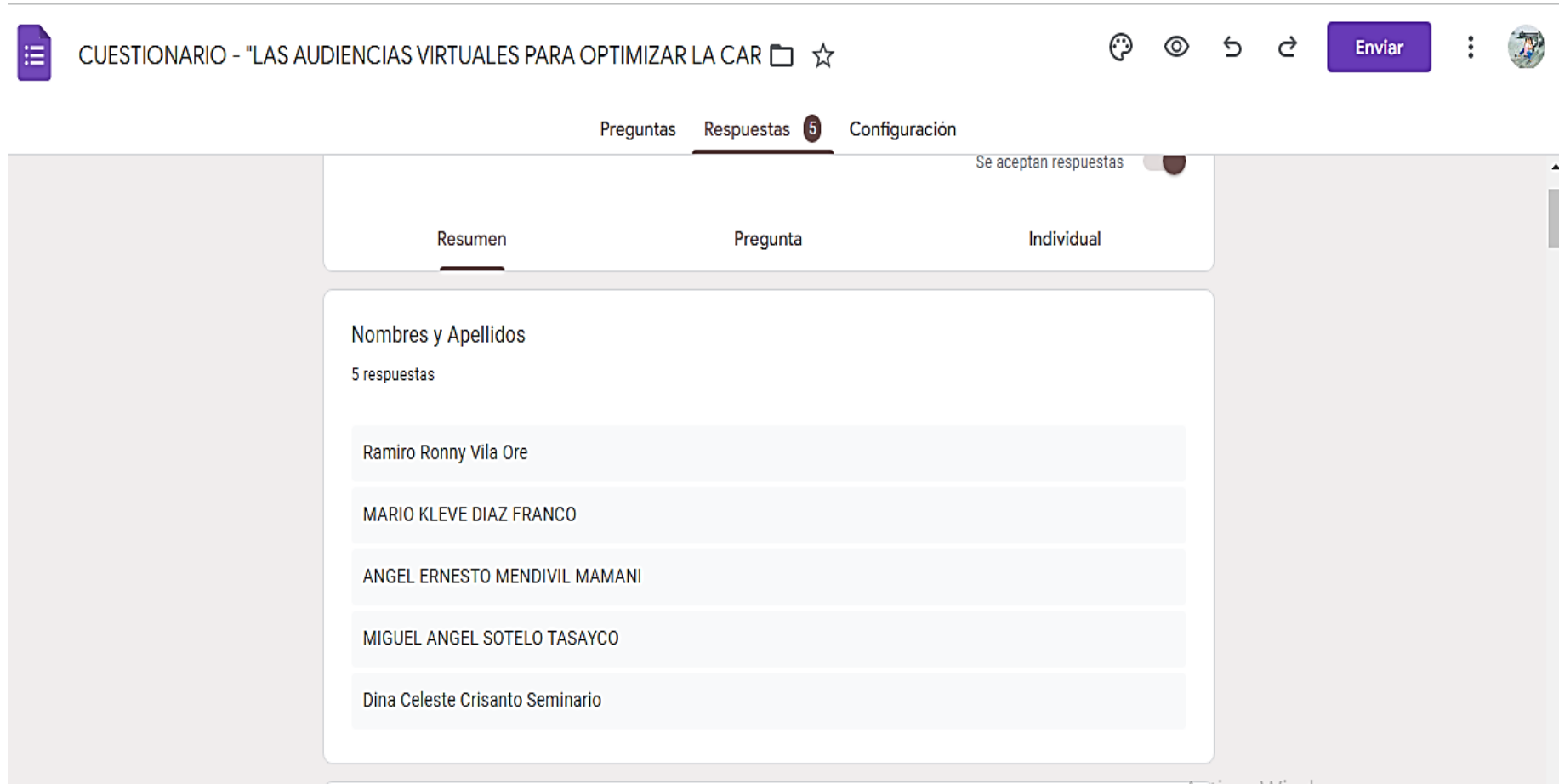
Figura N° 1: Listado de jueces y abogados trabajadores que participaron de las encuestas y entrevistas en google drive.