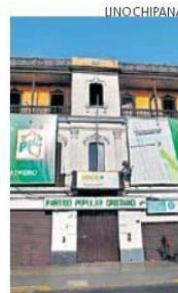
■ Empezarán de cero.

También quedaron fuera el Frepap, Victoria Nacional, Runayel Partido Nacionalista.