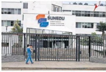
■ NO SE SALVA. La reforma universitaria en peligro.