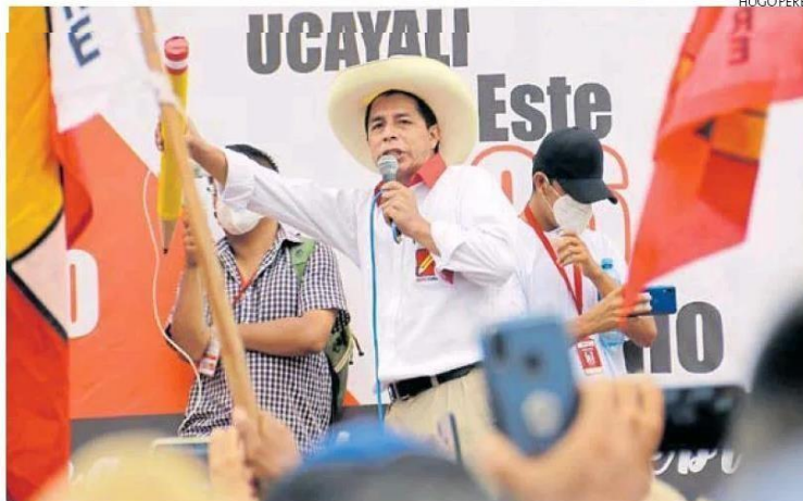
■ SIN CAMBIOS. Desde Iquitos, el candidato Pedro Castillo aremetió contra la prensa crítica, especialmente la de Lima.

Además, al retar a Fujimori a un debate en las plazas del país (ver página 8), Castillo le expresó: "Yo traigo al pueblo y usted a los grandes periódicos".