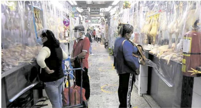
■ GOLPE A LA ECONOMÍA. La implementación del plan de Perú Libre provocaría el encarecimiento y/o escasez de la canasta básica familiar.