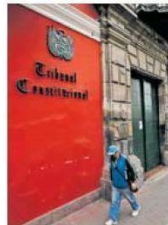
■ EN RIESGO. El TC y la Defensoría del Pueblo en la mira de Castillo.

■ Fujimori ha consolidado su mayor respaldo en Lima con 50%; en esa misma plaza Castillo registra solo 28%. Un 42% de encuestados considera que el docente impondrá un régimen dictatorial como el de Venezuela.